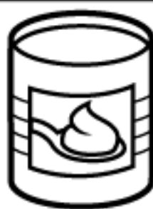
1 LATA DE LEITE CONDENSADO