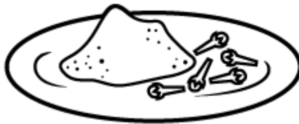
AÇÚCAR CRISTAL E OS CRAVOS