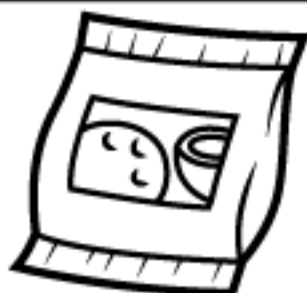
1 PACOTE DE COCO RALADO