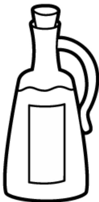
VINAGRE: ÁCIDO ACÉTICO OU ÁCIDO ETANOICO